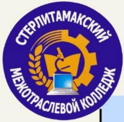
График работы приемной комиссии: